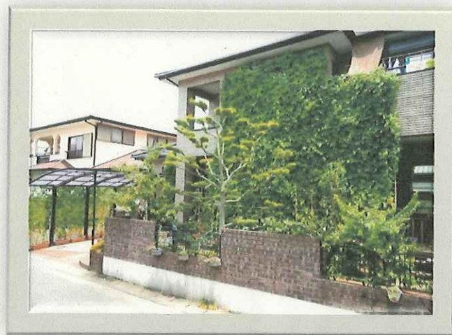
平成26年度グリーンカーテンコンテスト 最優秀賞

TEL : 0957-53-4111 (内142) 電子メール : kankyou@city.omura.ne.jp