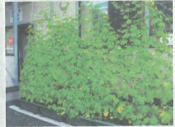
緑のカーテン設置場所案内図