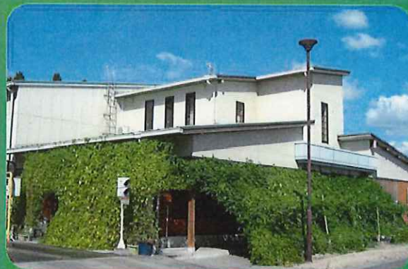
<昨年度 事業所部門 特別賞> 日田市バイオマス資源化センター