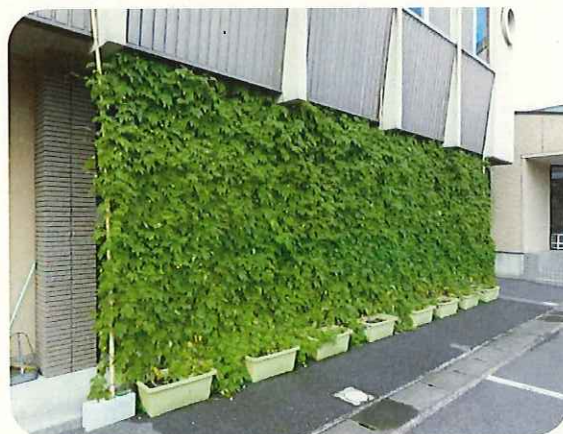
（写真左：昨年度小学校等部門賞作品 右：昨年度事業所部門賞作品）