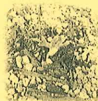
種を播いて約10日後のフウセンカズラ

種をまいてから約10日で発芽します。背丈が20cm程度に伸びたら、支柱やネットに誘引してください。ネット等に絡みだすと、成長が早くなります。